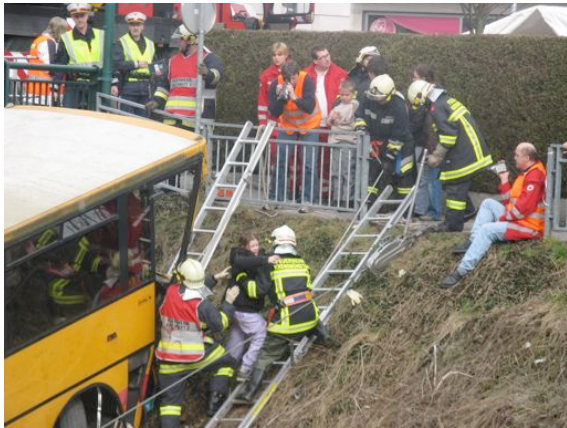
Übung mit FF-Kremsmünster