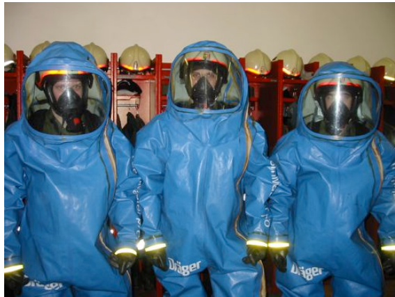
Übung mit Vollschutzanzügen