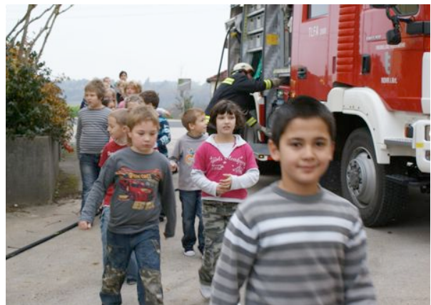
Übung in der Volksschule