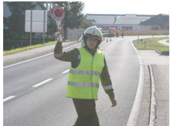
Verkehrsregler Lehrgang in Rohr