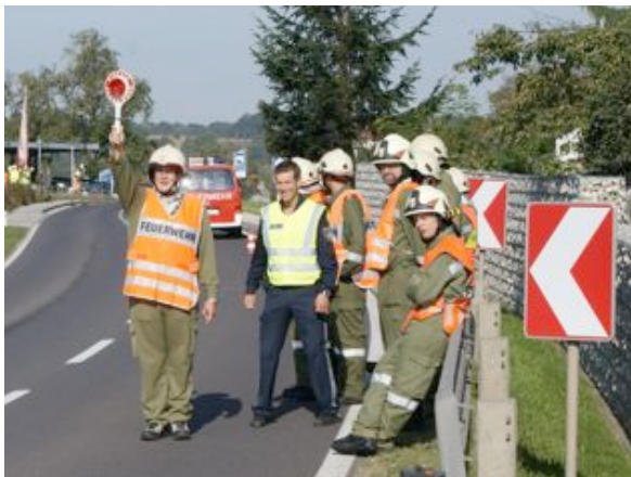
Verkehrsregler Lehrgang in Rohr