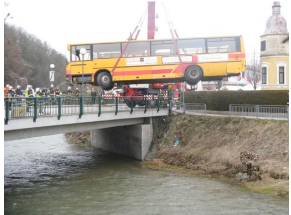
Übung mit FF-Kremsmünster